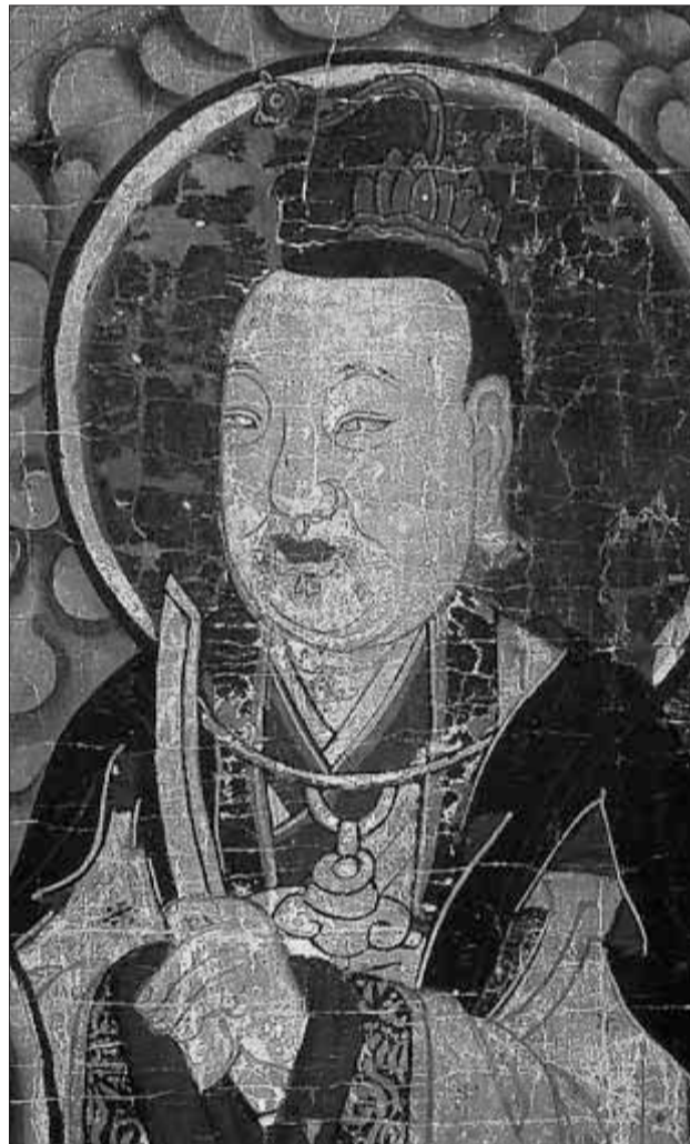
Imatge del 'Daodejing', de Laozi.